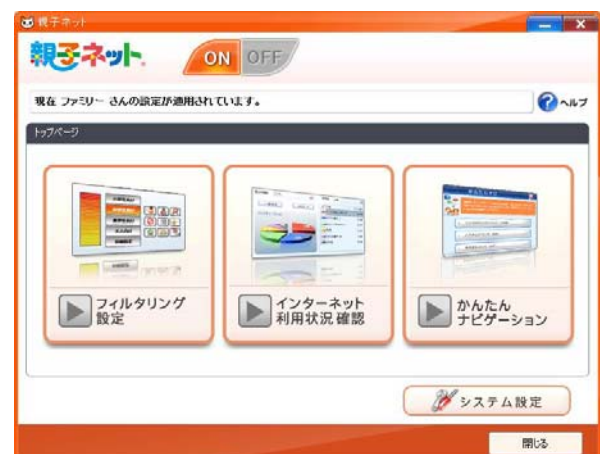
▲わかりやすい設定画面

また、万が一設定等の操作に迷われた際には、よくある質問から順番に表示している「かんたんナビゲーション」をご参照いただくことで、すぐに問題を解決することができます。