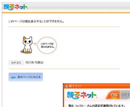
(上)インターネットタイマー (中)ブロック画面 (下)利用状況確認画面

設定画面から、「日時」「URL」「閲覧したカテゴリ」「検索単語」などの様々な観点から、お子さまのインターネット利用状況を一目で確認することができます。これにより、膨大な数の URL 履歴がカテゴリごとにとめて表示されるため、お子さまの興味や関心対象の傾向を瞬時に把握することができます。